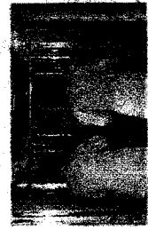
SANITA' E SINDACATO

giovani americane pellegrine del mondo, stanno osservando le nostre mura, ma anche al valore che questi spazi esterni e mentalità diverse che gli è avvenuto?